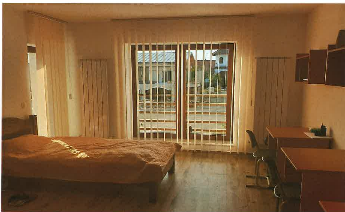
Fotografii din căminul seminarului