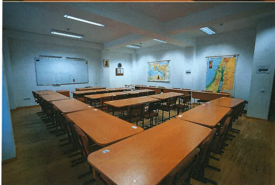
Săli de clasă