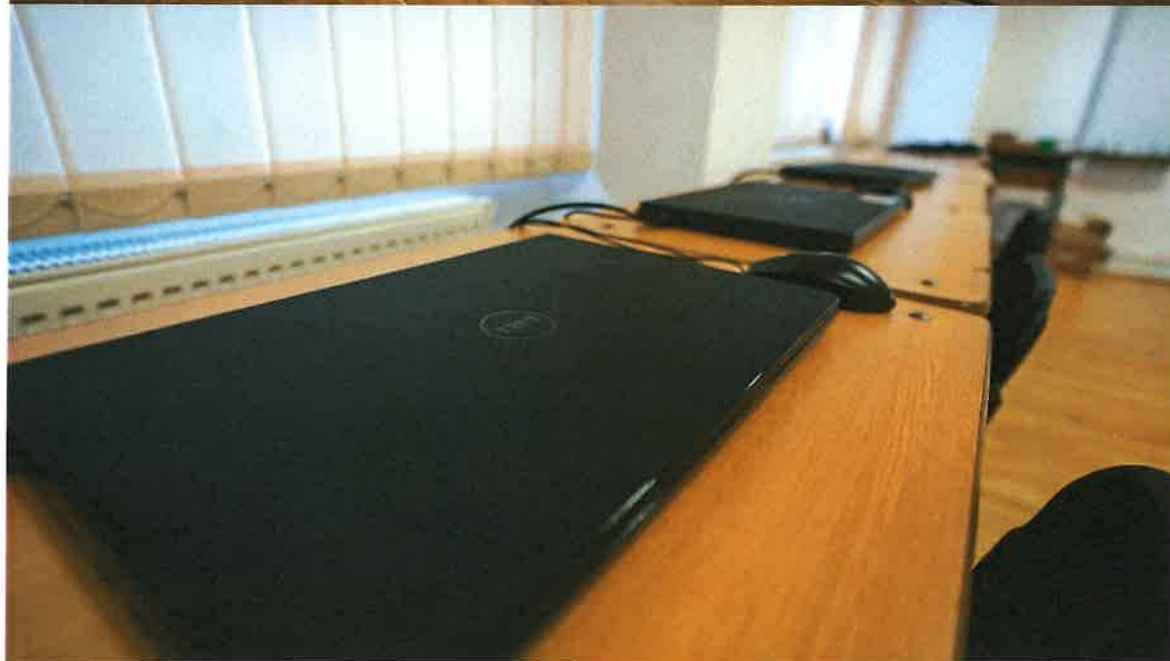
Cabinet de informatică